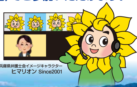
兵庫県弁護士会イメージキャラクター ヒマリオン Since2001

※参加費無料(Zoomによる参加にあたり使用する機器やインターネット接続にかかる費用は参加者においてご負担ください。)