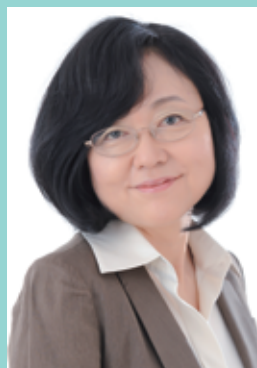
江川 紹子 氏 (ジャーナリスト)