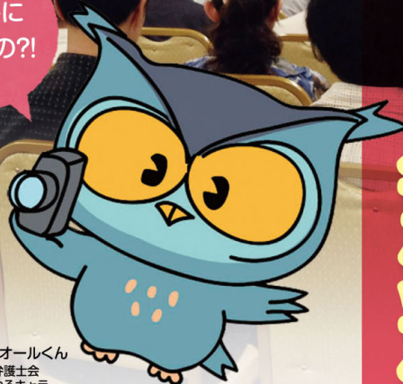
可視化オールくん 兵庫県弁護士会 可視化ゆるキャラ