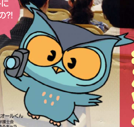
可視化オールくん 兵庫県弁護士会 可視化ゆるキャラ